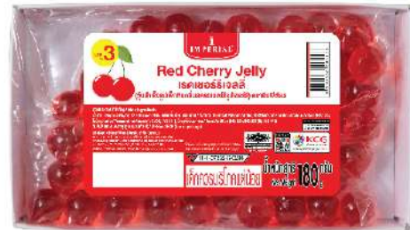
Red Cherry Jelly