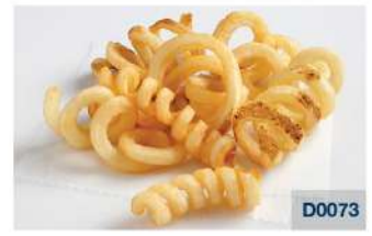
Twister / Curly