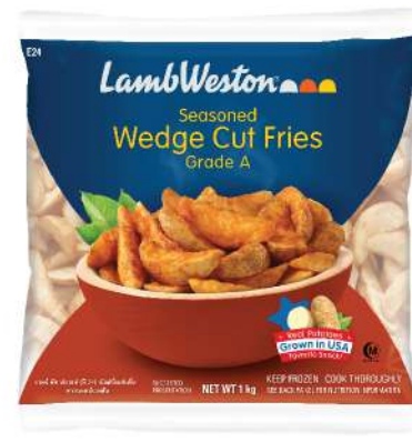
Seasoned Wedge Cut (E24)