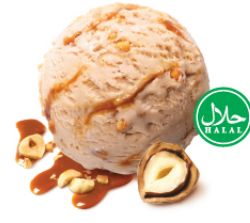
Hazelnut เฮเซลนัท