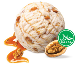
Maple Walnut เมเปิ้ล วอลนัท