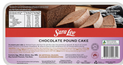
Chocolate Pound Cake