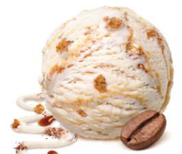
Tiramisu ทิรามิสู