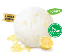
Lemon Sorbet เลมอนซอร์เบต