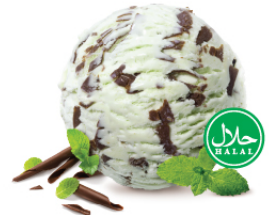
Mint Chocolate มินท์ช็อกโกแลต