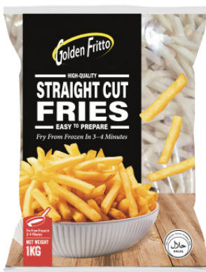
Regular Fries 3/8

บริษัทมุ่งมั่นพัฒนาสินค้า มันฝรั่งแช่แข็งเพื่อให้ได้สินค้าคุณภาพมาตรฐานสากลตั้งแต่การเพาะปลูก เพาะพันธุ์ ปรับปรุงคุณภาพของดินบริเวณที่เพาะปลูกสม่ำเสมอ วางระบบการไหลเวียนของน้ำและการปกป้องผลผลิตจากแมลง รวมถึงการใช้เทคโนโลยีการผลิตที่ทันสมัยเพื่อให้ได้มันฝรั่งคุณภาพที่ทั่วโลกยอมรับ