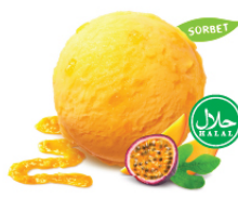
Passion Fruit & Mango แพชชั่นฟรุตแอนด์แมงโก