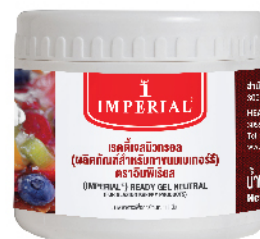
Ready Gel Neutral