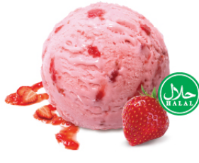
Strawberry สตรอว์เบอร์รี