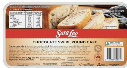
Chocolate Swirl Pound Cake