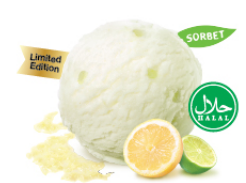
Lemon & Lime Sorbet เลมอน แล่ไลม์ซอร์เบต