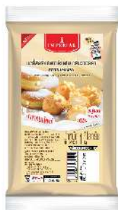
Dairy Filling Custard Cream Vanilla Flavour