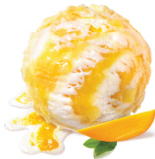
Mango & Cream แมงโก & แอนด์ครีม