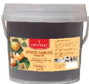
Apricot Piping Gel