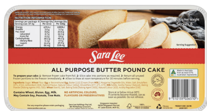
All Purpose Butter Pound Cake