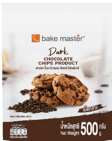
Dark Chocolate Chips Product

เบค มาสเตอร์ แบนด์สินค้ากลุ่มวัตถุดิบสำหรับทำเบเกอรี่ ที่มีคุณภาพระดับพรีเมียม รสชาติเข้มข้น ถูกปากคนไทย นอกจากนี้ยังประกอบไปด้วยสินค้าที่มีความหลากหลาย ไม่ว่าจะเป็นชีโกโกแลตชิพ คูกักัดสำเร็จรูป หรือสินค้ากลุ่มโดว์แช่แข็ง ที่เป็นที่ยอมรับสำหรับคนทำเบเกอรี่