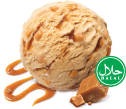
Caramelita คาราเมลลิต้า