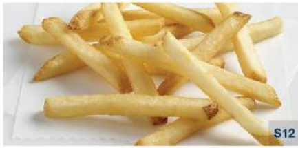
Thin Straight Cut (5/16" / 9 mm.)