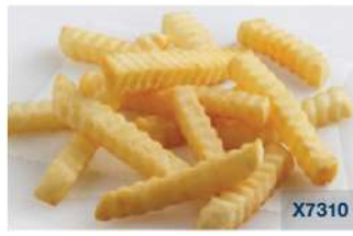
Crinkle Cut (1/2" / 13 mm.)