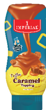
Toffee Caramel Topping