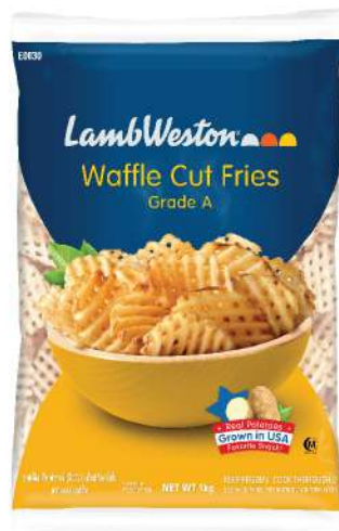
Waffle / Criss Cut (E0030)