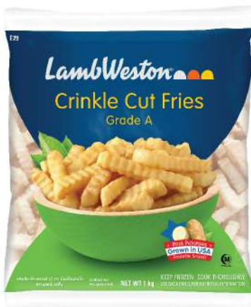
Crinkle Cut 1/2" (E29)