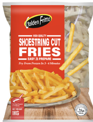
Shoestring Fries 1/4