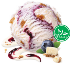
Blueberry Cheesecake บลูเบอร์รี่ชีสเค้ก