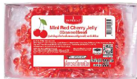
Mini Red Cherry Jelly