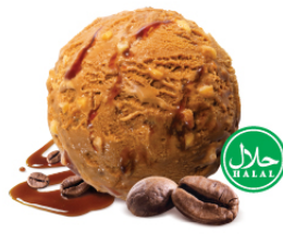
Espresso Croquant เอสเปรซโซ โครคอนท์