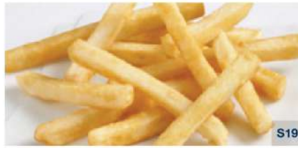
Regular Cut (3/8" / 10 mm.)