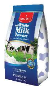
Milk Cream Powder