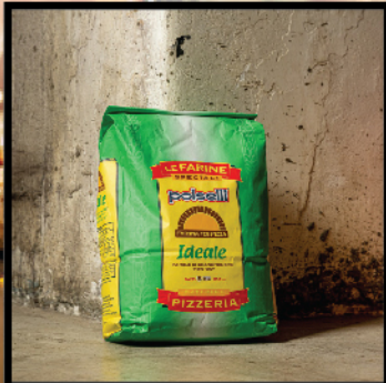
Ideale Soft wheat flour type "00"