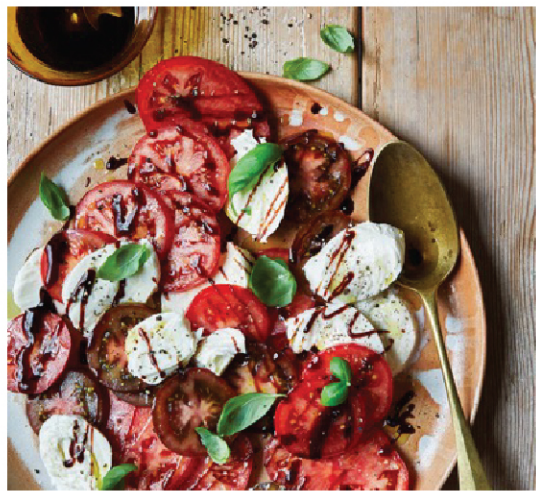
Mazzetti Vinegar Of Modena 1 Leaf

น้ำส้มสายชูบัลซามิกแห่งโมเดนาอยู่ในตระกูลมาซเซตตีมาสามชั่วอายุคน และตั้งแต่ปี ค.ศ.1976 แบรินด์มาซเซตตี เป็นหนึ่งในแบรนด์ที่จำหน่ายน้ำส้มสายชูบัลซามิกแห่งโมเดนา กันอย่างแพร่หลายมากที่สุดในประเทศสหรัฐอเมริกา น้ำส้มสายชูบัลซามิกของ Modena Mazzetti L'Originale ได้ผ่านการรับรองPGI (Protected Geographical Indication) ของสหภาพยุโรป ตั้งแต่เดือนมิถุนายน ปี ค.ศ.2009