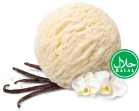
Vanilla Dream วานิลลา ดรีม