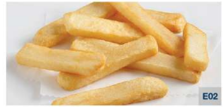
Steak House Cut (3/8" x 3/4" / 10 x 20 mm.)