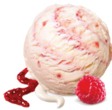
Raspberry Panna Cotta ราสเบอร์รี่แพนนาคอตต้า