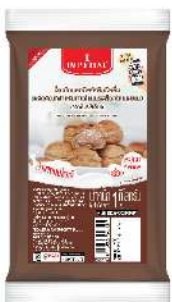
Chocolate Milk Cream Filling