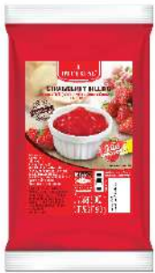
Strawberry Filling without Puree