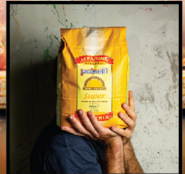
Super Soft wheat flour type "00"