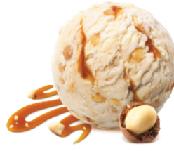
Macadamia แมคคาเดเมีย