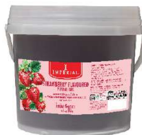
Strawberry Piping Gel