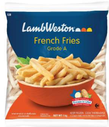
Regular Cut 3/8" (E28)