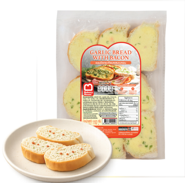
Garlic Bread (Bacon)