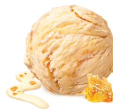
Creme Brulee แครมบริวว์เล