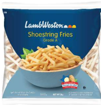
Shoestring Cut 1/4" (E26)