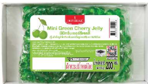
Mini Green Cherry Jelly