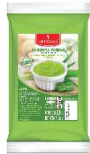
Sangkaya Pandan Filling