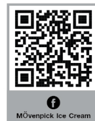
Mövenpick Ice Cream