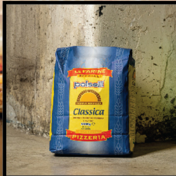
Classica Soft wheat flour type "00"