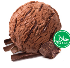
Swiss Chocolate สวิส ช็อกโกแลต