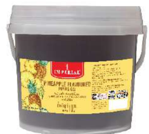
Pineapple Piping Gel