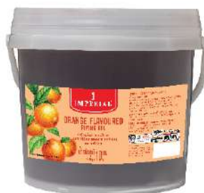
Orange Piping Gel