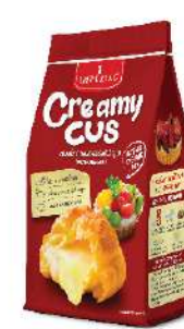
Creamy Cus Custard Powder