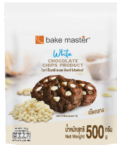
White Chocolate Chips Product