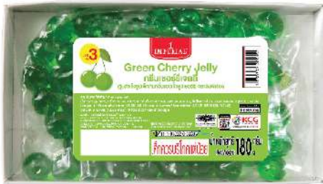
Green Cherry Jelly