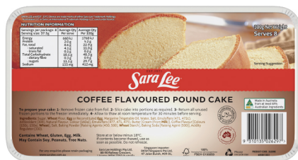
Coffee Flavoured Pound Cake