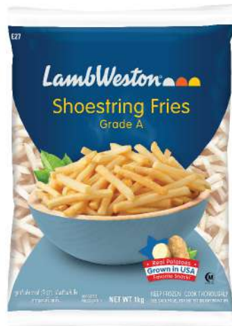
Shoestring Cut 1/4" (E27)