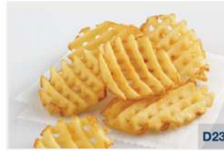
Waffle / Criss Cut