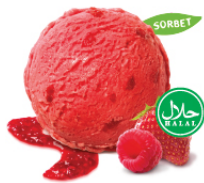
Raspberry & Strawberry ราสเบอร์รี่แอนด์สตรอว์เบอร์รี