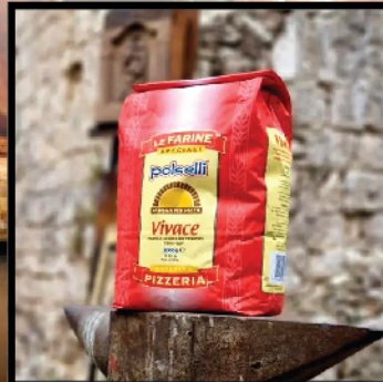
Vivace Soft wheat flour type "00"