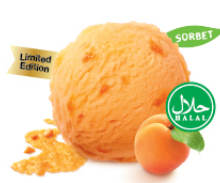
Apricot Sorbet แอปริคอตซอร์เบต